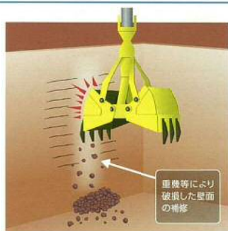
重機等により破損した壁面の補修